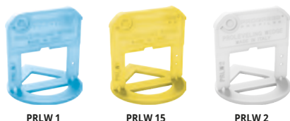
Livellatori H 12-20 mm