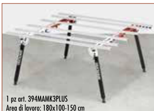
1 pz art. 394MAMK3PLUS Area di lavoro: 180x100-150 cm