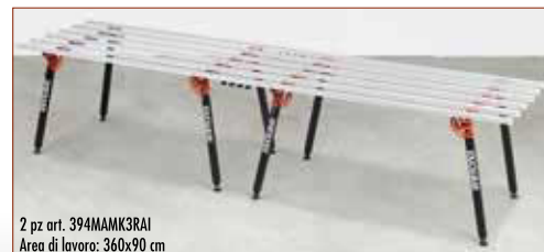
2 pz art. 394MAMK3RAI Area di lavoro: 360x90 cm