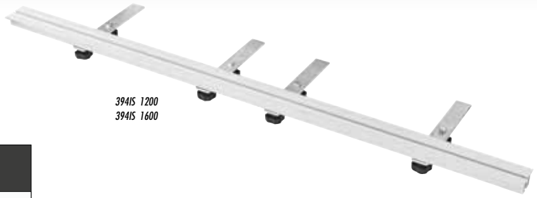
394IS 1200 394IS 1600