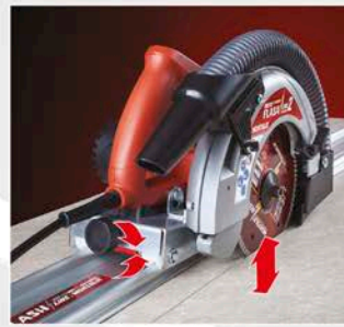
9 Altezza di taglio regolabile. Adjustable cutting height.

Self-adjusted vacuum system "no DUST", allows the full dust removal and a perfect cooling