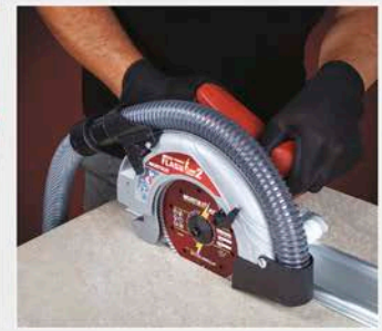
10 Massima ergonomia. Best-in-class ergonomics.