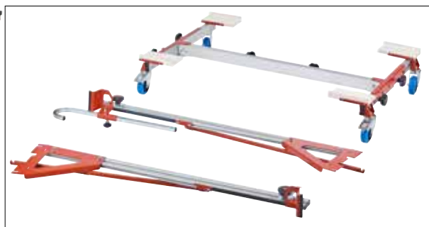
CAM MkIII smontato.