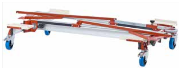
CAM MkIII in posizione di trasporto.